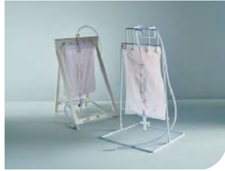
Ayağa asılan gece torbası

Bacak torbası, sondanıza bağlıdır ve bu torba bacağınıza bağlanır. Sabitleyici kemerin bacak torbasının arkasından dolaştığına emin olun. Böylece, idrarın akışını kesemez. Torbanın her zaman idrar kesenizden aşağı seviyede olmasını sağlayın. Hemşire size bunu nasıl yapacağınızı gösterecektir.